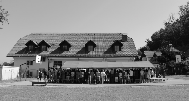
FOTO UTRINKI - ORATORIJ SOSTRO 2023