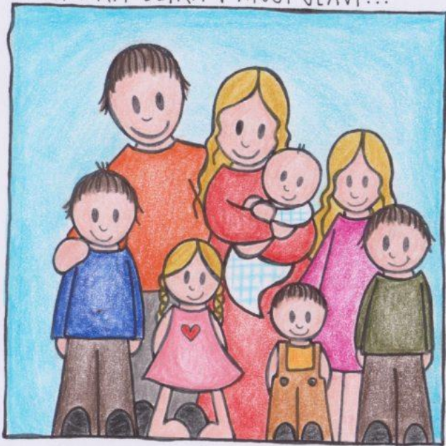
DRUŽINSKA SLIKA V MOJI GLAVI...